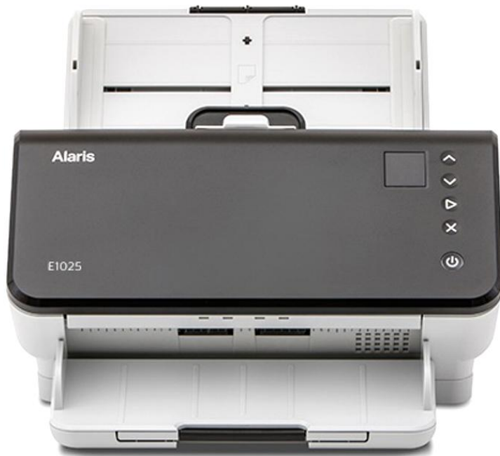
Сканер Alaris E1025 арт. 1025170