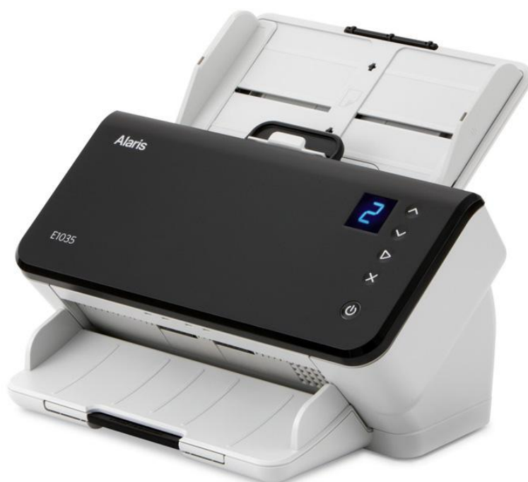
Сканер Alaris E1035 арт. 1025071

Изготовитель: «Kodak Alaris Inc.», 2400 Mount Read Blvd. Rochester, New York 14615, USA